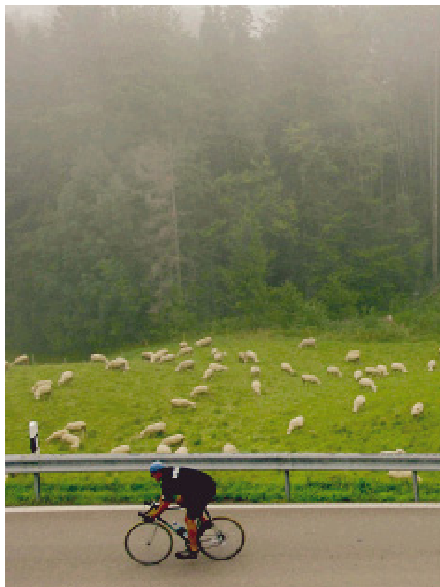
KLASSISCH: Einsam kämpft sich ein Fahrer des Teams Züri 3 die Bucheneggstrasse