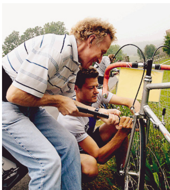
FRISCHLUFT: Mit vereinten Kräften wird das Velo startklar.