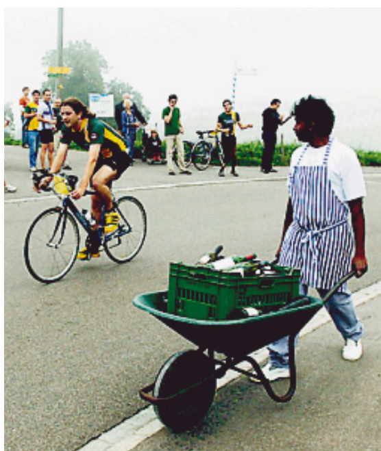
AM ZIEL: Einer hats geschafft, der andere schiebt noch.

Sein Kommentar nach getaner Arbeit: «Ich ha glitte wie d Sau!», dazu ein verschmitztes Lächeln. DJ Staromat drückte sich da schon nüchterner aus: «Dobe», war alles, was er herausbrachte. Und den Ehrgeizigen sprach Schramm, dessen Chettehund die Mannschaftswertung vor den Teams Flachpass und Züri 3 gewannen, aus dem Herzen: «Im Training war ich eine Minute schneller.»